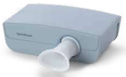
Spiromètre à ultrasons SpiroScout SP plus