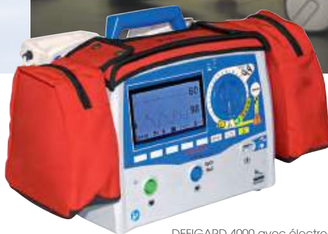
DEFIGARD 4000 avec électrodes de poing et sacoche

L'appareil peut être décroché en un seul mouvement.