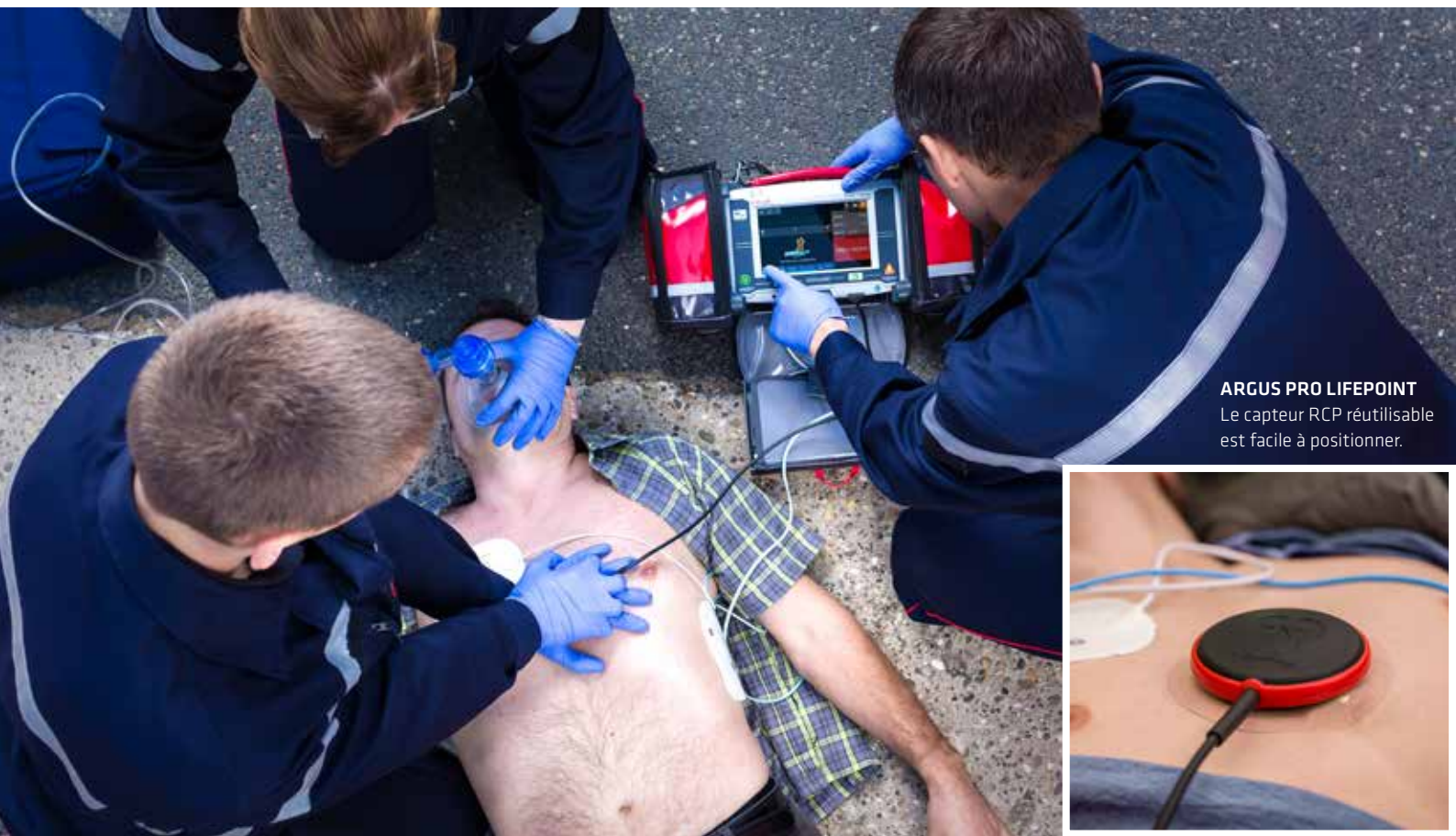
ARGUS PRO LIFEPOINT Le capteur RCP réutilisable est facile à positionner.