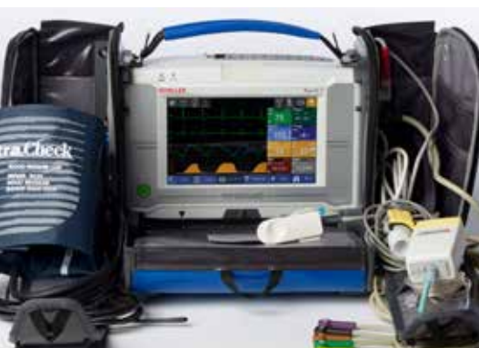
PHYSIOGARD TOUCH 7 MONITEUR