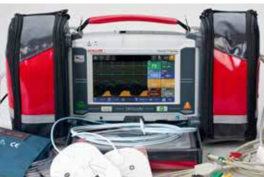
DEFIGARD TOUCH 7 MONITEUR / DÉFIBRILLATEUR

Les appareils DEFIGARD Touch 7 et PHYSIOGARD Touch 7 (DGT7/PGT7) sont tous deux d'indispensables outils pour les secouristes. Dans ses deux versions, soit défibrillateur/moniteur ou seulement moniteur, l'appareil est très compact et inclut les fonctions de défibrillation les plus modernes ainsi qu'un vaste éventail de fonctions de monitoring. Il est le premier défibrillateur/moniteur d'urgence doté d'un écran tactile ce qui en fait l'appareil le plus intuitif du marché. Il est également équipé de solutions de transmission de données ultra modernes.