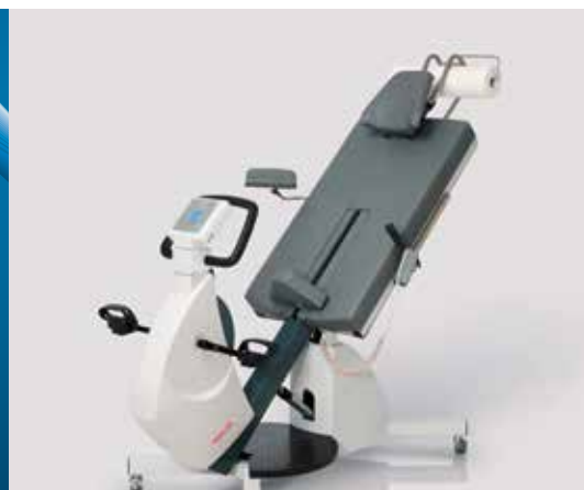
ERG 911 L : ergomètre de sécurité en position allongée/semi-allongée, avec inclinaison variable de 0° à 45°